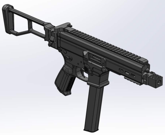
1.1 ATE L S LAH