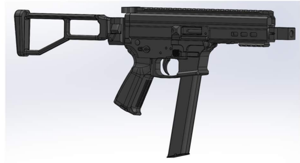
1.2 ATE L S LAH