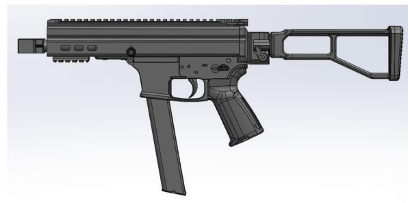
1.4 ATE L S LAH